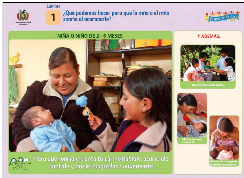
Lámina 1 ¿Qué podemos hacer para que la niña o el niño sonría al acariciarlo?

Para la orientación a la madre y la familia sobre las prácticas de desarrollo.